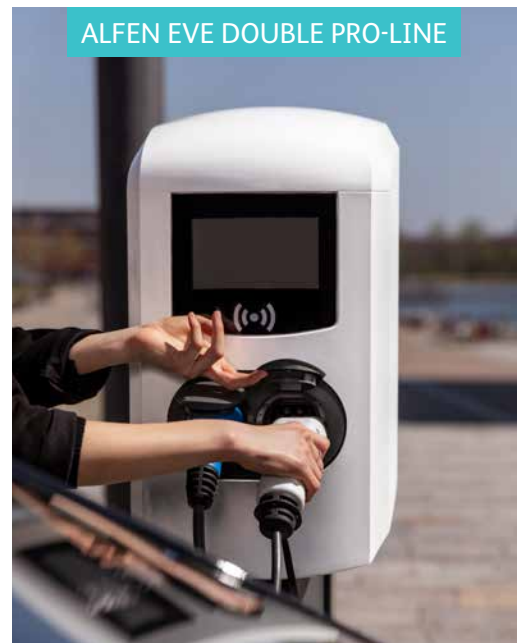
ALFEN EVE DOUBLE PRO-LINE

Au bureau, vous pouvez compter sur le chargeur Alfen Eve Double Pro-line. Le double connecteur permet à deux voitures par installation de charger simultanément. Cette borne de recharge ne comprend pas de câble fixe. Cette solution de recharge peut être installée au mur ou sur un poteau de montage. Vous pouvez autoriser l'accès uniquement à vos collaborateurs ou ouvrir votre (vos) borne(s) de recharge à des tiers au tarif de votre choix. Vous pouvez même faire en sorte que vos bornes de recharge ne soient pas visibles dans d'autres applications pour VE.