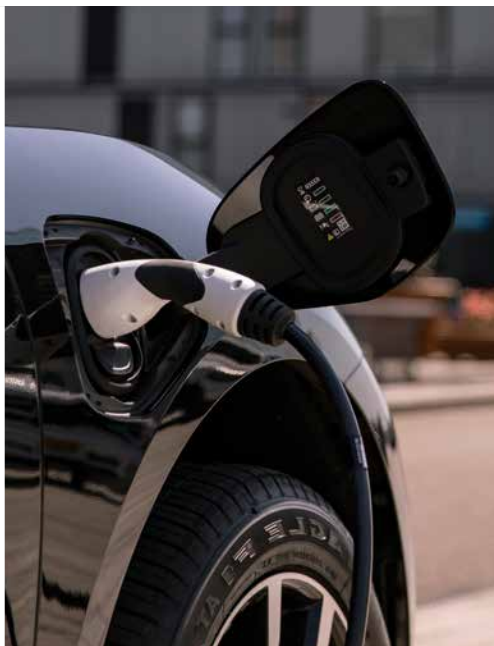
ALFEN EVE SINGLE PRO-LINE